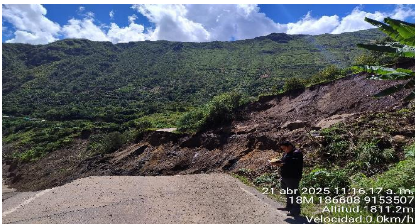
FIGURA N°02: EN EL RECORRIDO SE OBSERVA QUE EL RIO CHUSGON , EN SU MARGEN DERECHA VIENE DESTRUYENDO VIA PRINCIPAL HACIA PROVINCIA BOLIVAR.