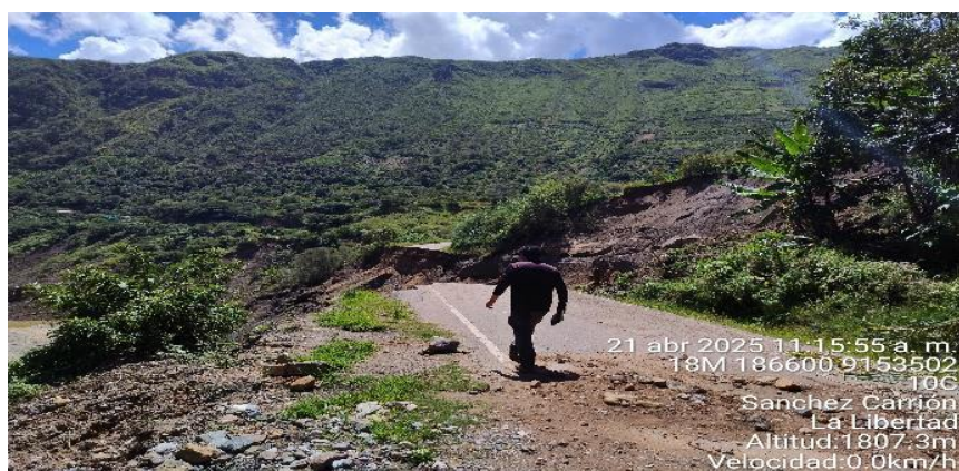
FIGURA N°03: PARTE DEL TRAMO DEL RIO CHUSGON HA AFECTADO VIA HACIA PROVINCIA BOLIVAR SE REQUIERE UNA PROTECCION CON ENROCADOS EN LA AMRGEN DERECHA