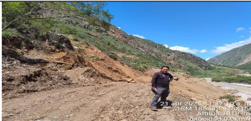
FIGURA N°01: RECORRIDO E IDENTIFICACION DE TRAMOS CRÍTICOS DESDE EL PUNTO DE INICIO, DONDE SE PUEDE VISUALIZAR QUE EL RIO CHUSGON EN SU MAREGEN DERECHA AFECTADO A CULTIVOS Y VIA, EROSIONANDO TERRENOS EN MAXIMAS AVENIDAS.